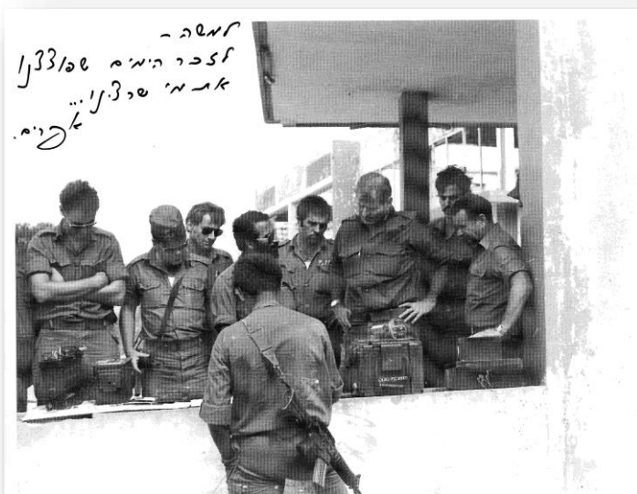
אל"ם משה פרנקל בהצגת אמצעים למפקד פיקוד הצפון דאז, אלוף אמיר דרורי (לפני הכניסה למזרח ביירות)