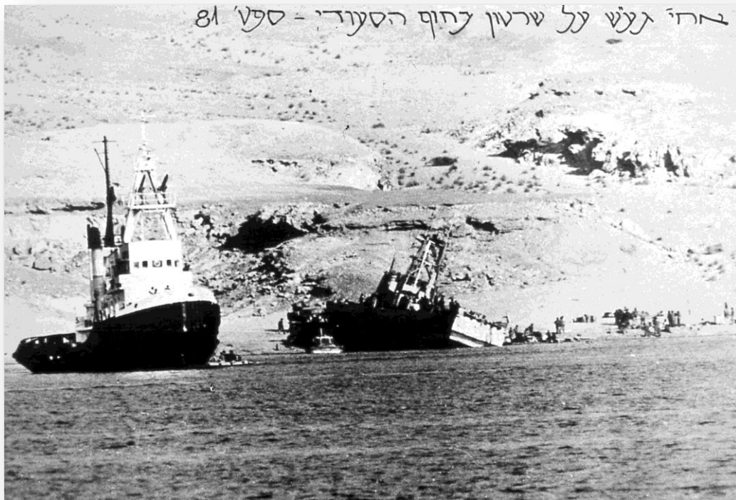
חילוץ אח"י "געש" מחופי סעודיה